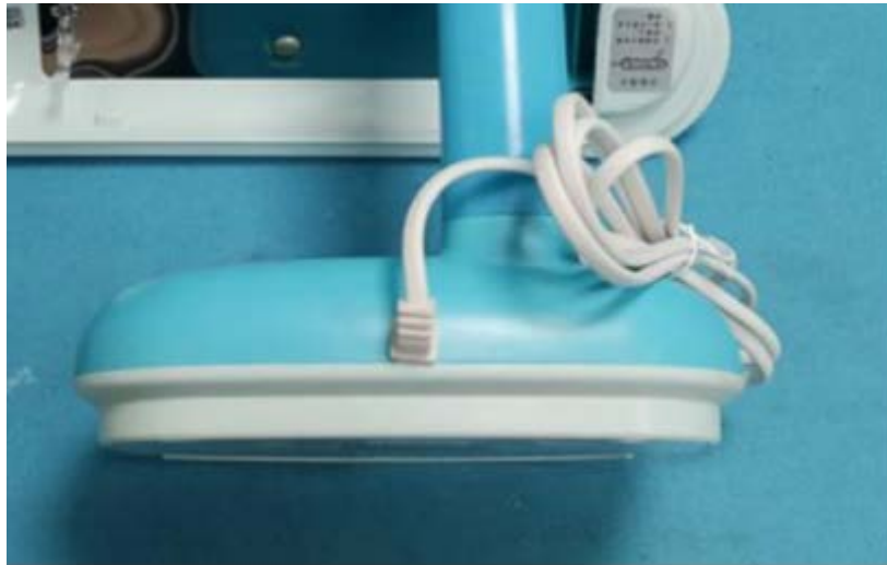
示例：电源线有线扣保护

材质、粗细、布置工整度等。选购时可稍微用力拉扯下电源线，电源线不应松动或被拉出。电源线的松动容易导致产品内部接线处受到应力从而松脱，造成触电事故。如果电源软线有松动，应避免购买。