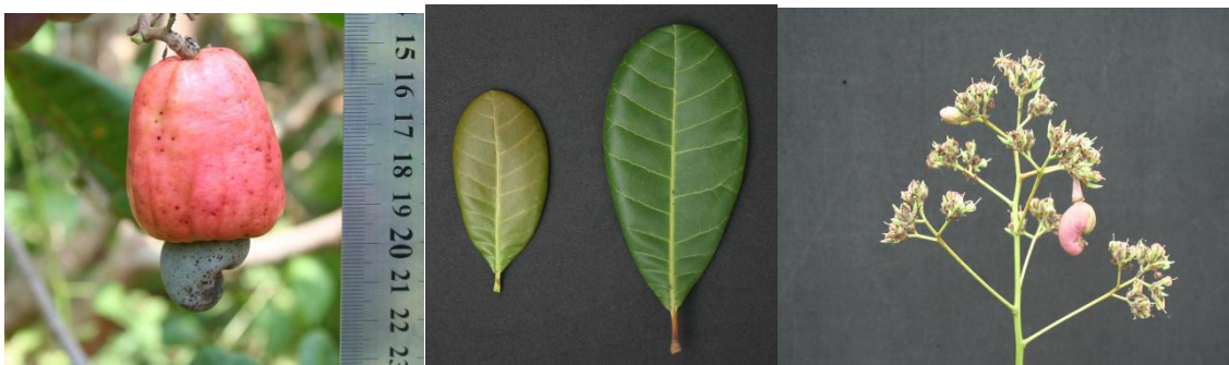
E: 腰果 'CP63-36' 果梨、叶片花序形态