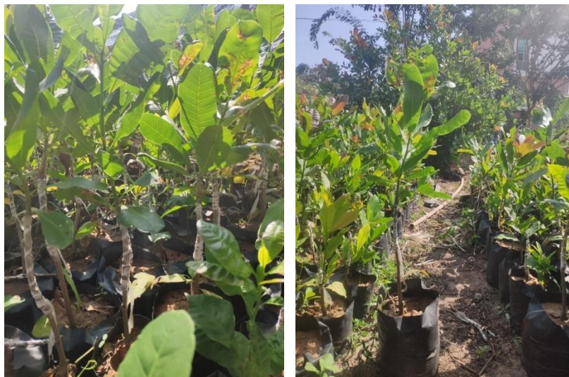
图9 腰果嫁接苗出圃标准