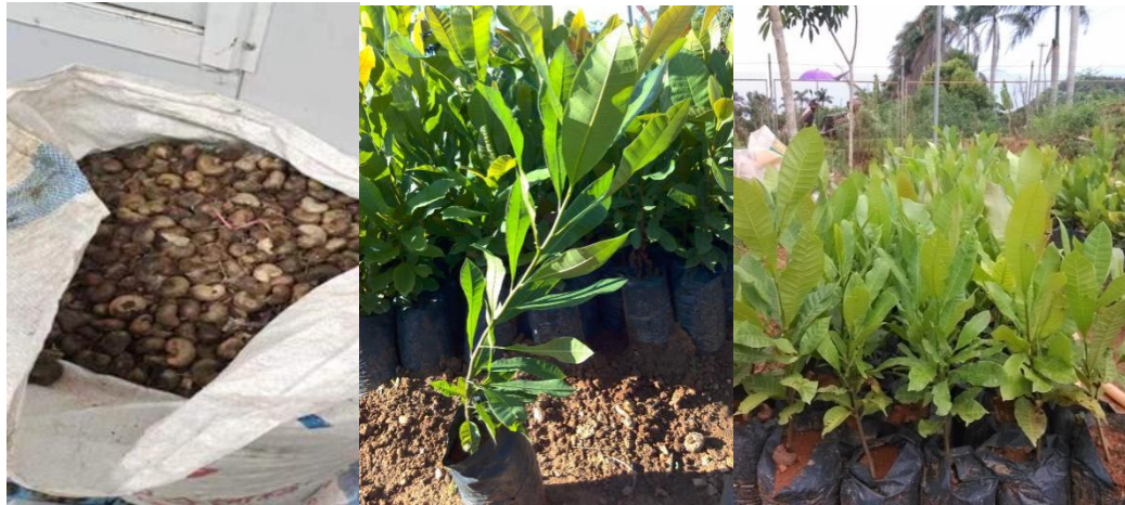
图 5 腰果砧木苗繁育

播种后注意经常保湿，以育苗基质有一半见白为界，干旱即要淋水。出芽见叶后，可施薄粪水或 1 %尿素溶液，每隔 10 d~15 d 淋施一次，肥料浓度可逐次增加。在苗高 30.0 cm ~40.0 cm 时打顶（图 5），以促苗茎增粗生长，方便嫁接。在砧木苗繁育过程中，要及时除尽苗床、步道及棚内其余空间杂草。