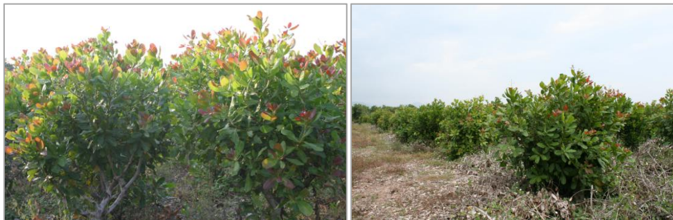
图 2 腰果种苗接穗采穗圃

级采穗圃。一级采穗圃单株隔离或整园隔离，因腰果树形大，种植面积较需求大，一般根据需求采用单株隔离，需要时可在顶部及四周用 60 目或 80 目的防虫网覆盖。严格按照种质圃管理方式，入口设有缓冲消毒隔离区。