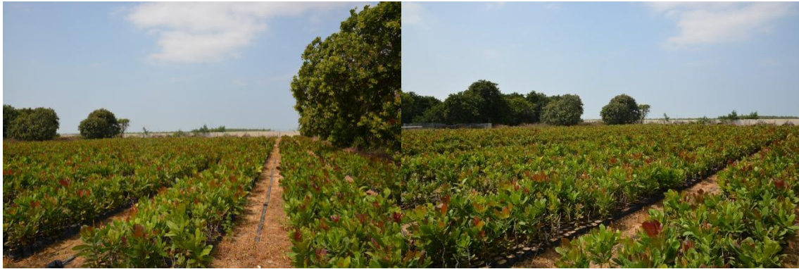
图 3 乐东腰果种苗繁育基地

步道宽 80 cm~120 cm；建设育苗大棚，棚高 2.0 m~4.0 m, 棚顶与四周覆盖薄膜和透光度为 50 %~60 %的遮阳网。