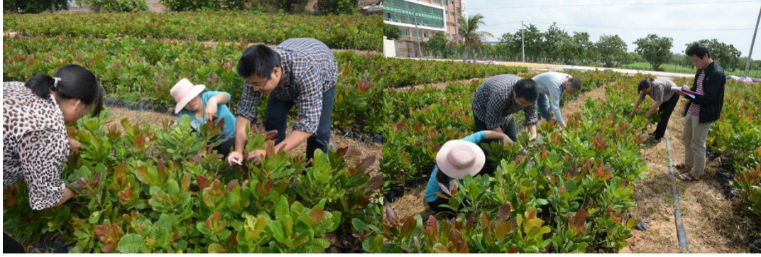
图 1 种苗繁育基地调研和检测